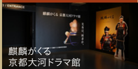
麒麟がくる 京都大河ドラマ館