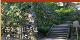
丹波亀山城址 城下町散策