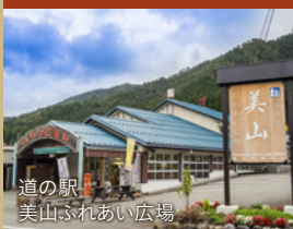
道の駅 美山ふれあい広場