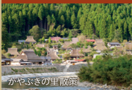
かやぶきの里散策