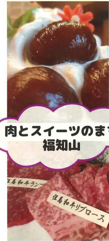
肉とスイーツのまち 福知山