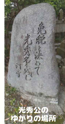
光秀公のゆかりの場所