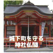
城下町を守る 神社仏閣