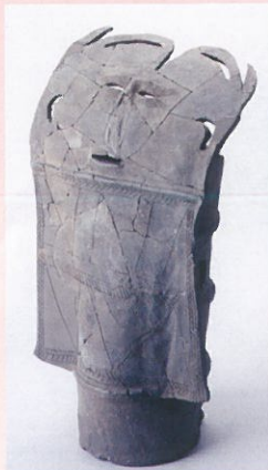
盾持ち人形埴輪 (時塚1号墳出土)

自然と対話し、守り伝えた中で信仰や芸術が生まれ、地域コミュニティが育まれてきた姿にふれることにより、ふるさと亀岡ゆかりの絵画作品や文化財に興味・関心を持っていただける契機にしたいと思っています。夏休みの間に親子で楽しめる文化財の中の「動物探し」を楽しんでください。