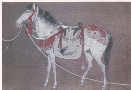
円山応挙・応瑞筆「板絵著色繫馬図」(小幡神社蔵)