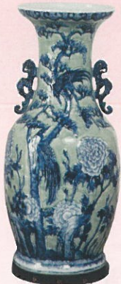
青磁染付 彫花牡丹木蓮尾長鳥 双耳大花瓶 (法常寺蔵)