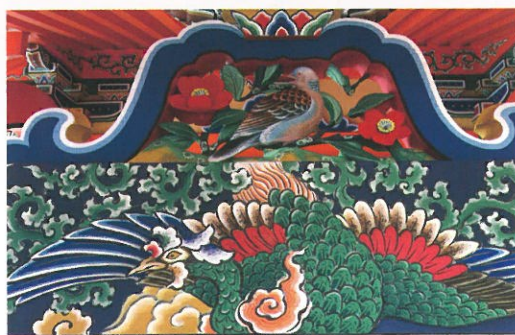
幕股に描かれた鳳凰と鳩 (保津町、八幡宮社本殿)