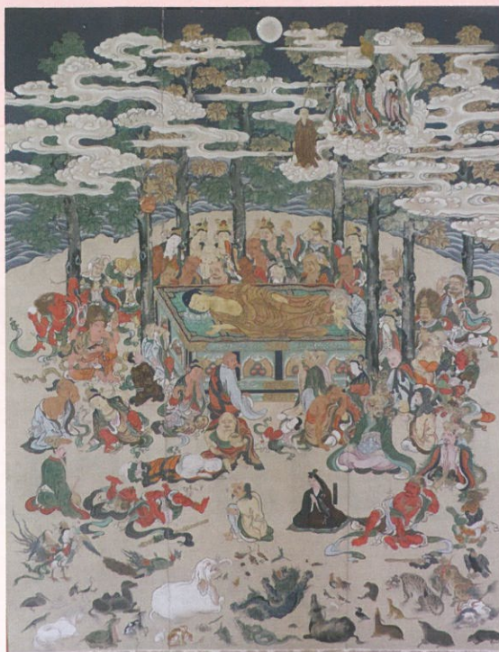
紙本著色仏涅槃図 (嶺樹院蔵)