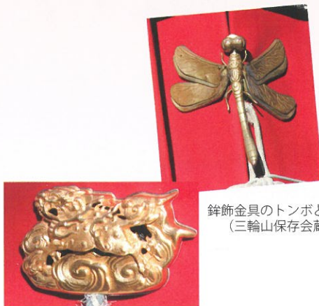
鉦飾金具のトンボと麒麟 (三輪山保存会蔵)