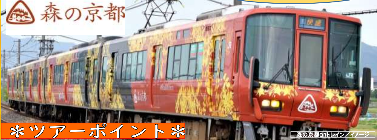
森の京都QRトレイン/イメージ