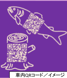
車内QRコード/イメージ