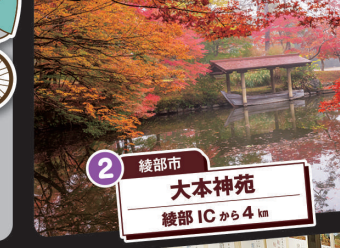
2 綾部市 大本神苑 綾部ICから4km