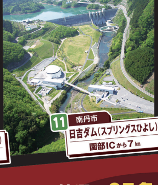
11 南丹市 日吉ダム(スプリングスひよし) 園部ICから7km