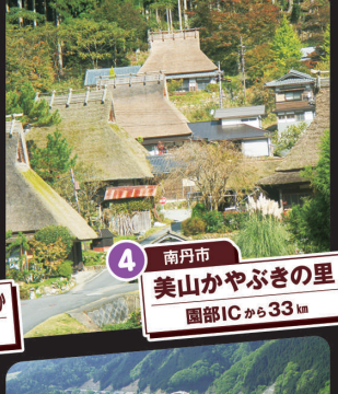
4 南丹市 美山かやぶきの里 園部ICから33km