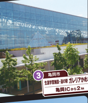
3 亀岡市 生涯学習施設・道の駅 ガレリアかめおか 亀岡ICから2km