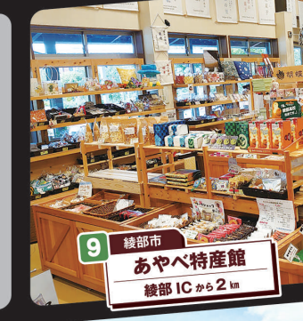
9 綾部市 あやべ特産館 綾部ICから2km