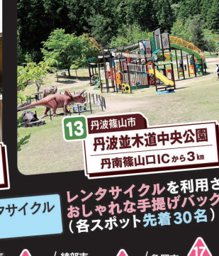
13 丹波篠山市 丹波並木道中央公園 丹南篠山ICから3km