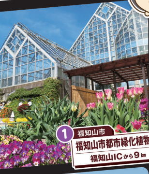
1 福知山市 福知山市都市緑化植物園 福知山ICから9km