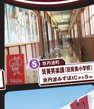
5 京丹波町 質美笑楽講(旧質美小学校) 京丹波みずほICから5km