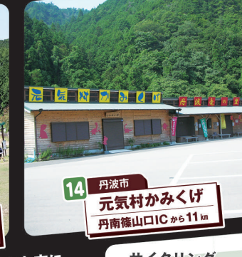
14 丹波市 元気村かみくげ 丹南篠山ICから11km