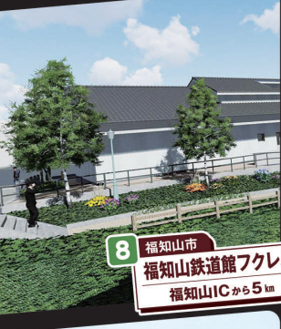
8 福知山市 福知山鉄道館フレクル 福知山ICから5km