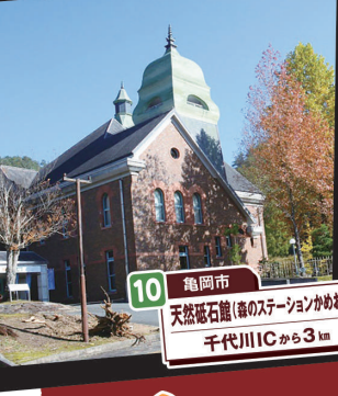
10 亀岡市 天然庵石蔵(道のステーションかめおか) 千代川ICから3km