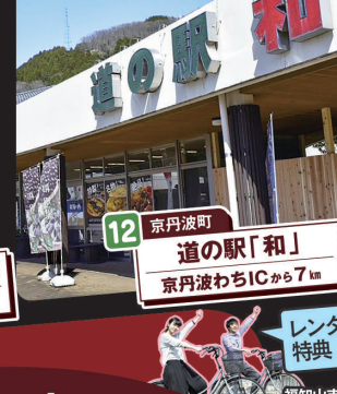
12 京丹波町 道の駅「和」 京丹波わちICから7km