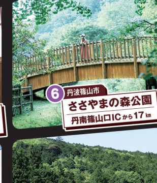
6 丹波篠山市 ささやまの森公園 丹南篠山ICから17km