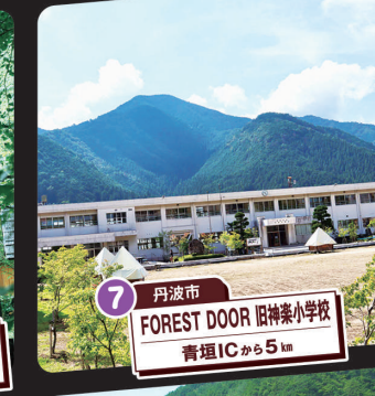
7 丹波市 FOREST DOOR 旧神楽小学校 青垣ICから5km