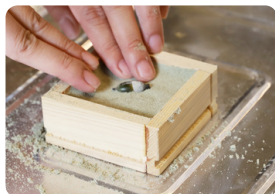
どんぐりで鑄型をつくります