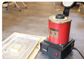
垂鉛を鑄型に流し込みます