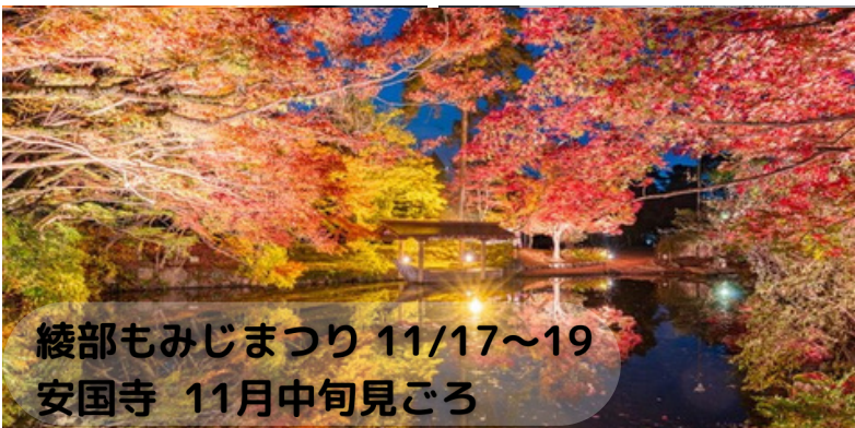
綾部もみじまつり 11/17～19 安国寺 11月中旬見ごろ