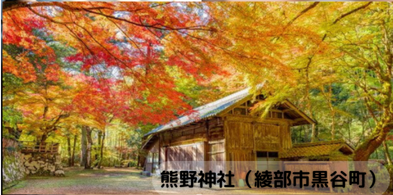
熊野神社（綾部市黒谷町）