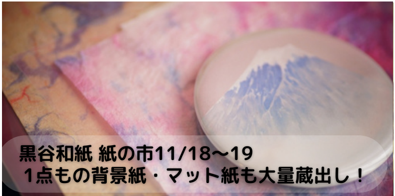
黒谷和紙 紙の市11/18～19 1点もの背景紙・マット紙も大量蔵出し！