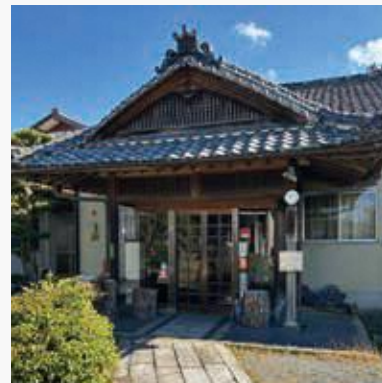
座学会場の亀岡市旭町自治会館

科学的根拠に基づいた栽培知識と、高度にデータを活用したコツやカンだけに頼らない有機農業を学べます。